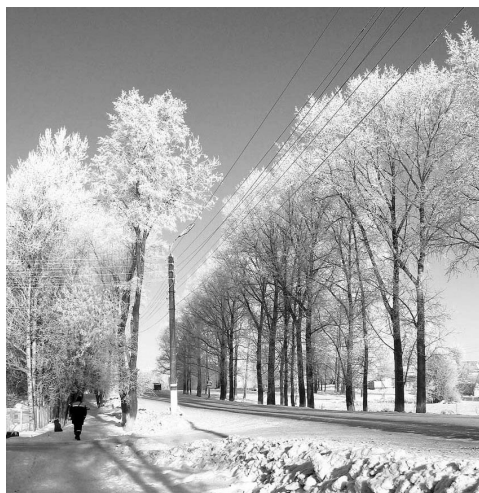
Мороз и солнце...

Из того ли то города из Воротынска, Из той ли улицы да Школьной, Выходили ребятушки удалые. Бежали ножками резвыми, На линейку, да на школьную. Два шага вперед, а четыре назад.