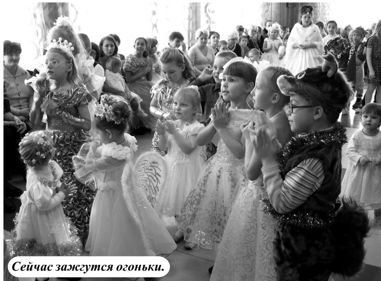
Сейчас зажгутся огоньки.